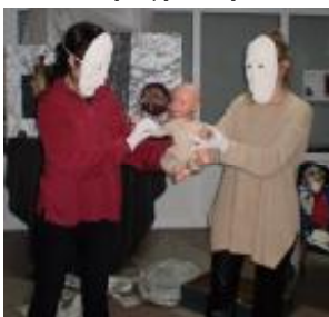
Епатаж — постійний супутник СТАНівців

Луганське літературне угруповання СТАН відсвяткувало 10-ліття з часу заснування. Подія була відзначена концертом, де на одній сцені з поетами виступали рок-групи. Але найцікавішим було оголошення про створення нової літературної премії.