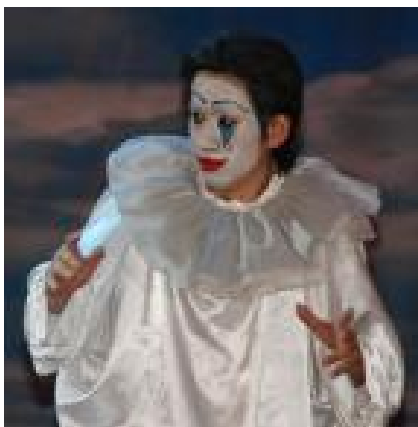
«Паяци» — найпопулярніша опера Леонкавалло. Уперше глядач побачив її в 1892 році в Мілані.

Супровід здійснюють змішаний хор Інституту культури і мистецтв, частко-