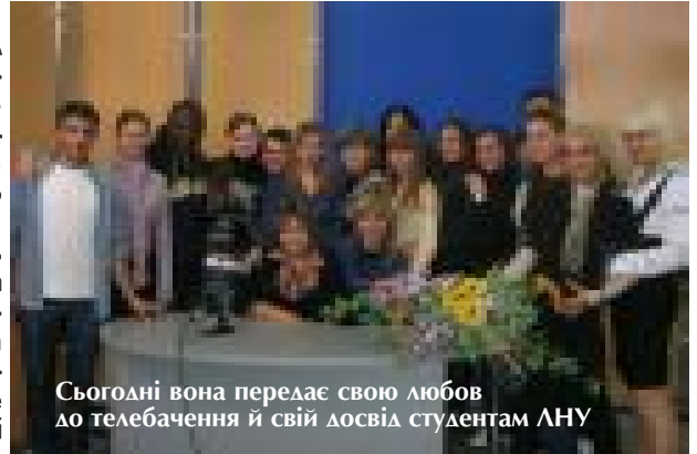
Сьогодні вона передає свою любов до телебачення й свій досвід студентам ЛНУ

вої інформації. Посередником між суспільством та інформацією став журналіст. Услухайтеся в слово «журналіст»: воно звучить гордо, але що за цим словом? Робота журналіста дуже трудомістка, це не тільки активний пошук інформації, а ще й обробка, глибоке осмислення сенсу подій, фактів. Творча діяльність журналіста пов'язана з умінням отримувати інформацію, інтерпретувати її, аналізувати соціальні явища тощо.