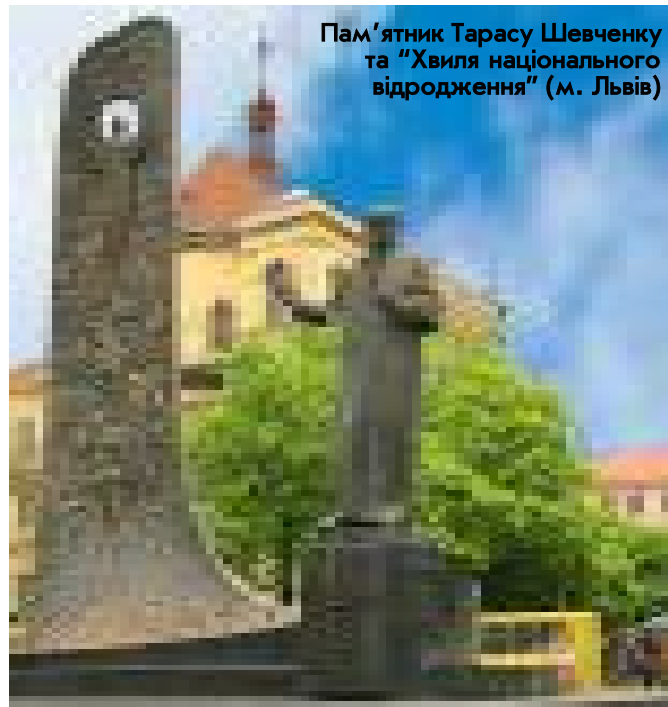
Пам'ятник Тарасу Шевченку та "Хвиля національного відродження" (м. Львів)

Титул «Міс аеробіка-2009» цього року отримала... китайка Цюань Тін. Українським дівчатам є чого в неї повчитися. Читайте на стор. 6.